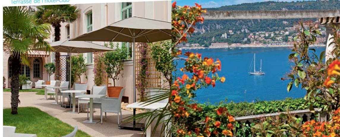
Terrasse de l'hôtel-club