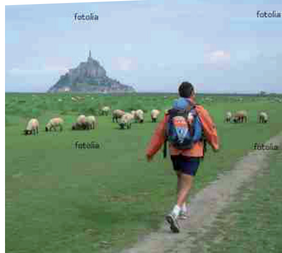
Le Mont Saint-Michel

*Animaux : admis sous réserve d'avoir été signalés au moment de l'inscription, d'acceptation des règles d'hygiène, des dispositions vétérinaires (se munir du carnet de vaccination à jour). Non admis dans les parties communes. Les animaux doivent être tenus en laisse sur l'ensemble de la propriété. Ne sont pas acceptés les animaux dangereux (catégories 1, 2 et NAC). Ces règles doivent être respectées sous peine de se voir interdire l'accès à l'établissement.