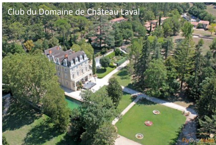
Club du Domaine de Château Laval

Que l'on profite des embruns de la Mer Méditerranée à St-Jean Cap Ferrat ou Hyères-les-Palmiers, de la quiétude de la campagne au cœur du parc du Verdon, de l'air frais de la montagne près du lac de Serre-Ponçon ou encore d'un environnement préservé face à l'Océan Atlantique; les vacances de Pâques avec Vacances Bleues seront placées sous le signe de la prestidigitation !