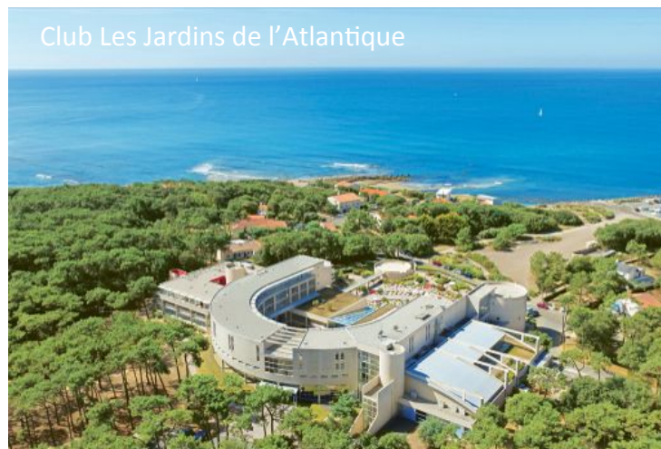
Club Les Jardins de l'Atlantique